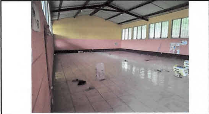
Foto1: Colocación de piso cerámico.